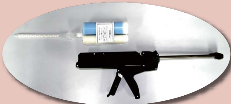
樹脂グラウト施工器具