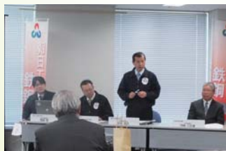
本社会議室にて記者会見を実施