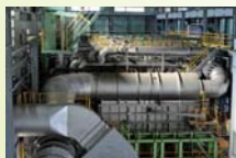
工場で使用される燃料の天然ガス化