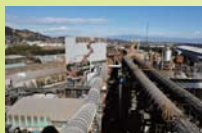
製鋼集塵機の強化