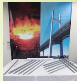
エポキシ鉄筋の展示