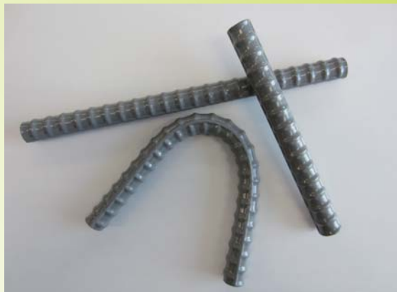
防食鉄筋(エポキシ鉄筋)