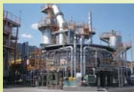
製鋼電気炉ダスト処理設備