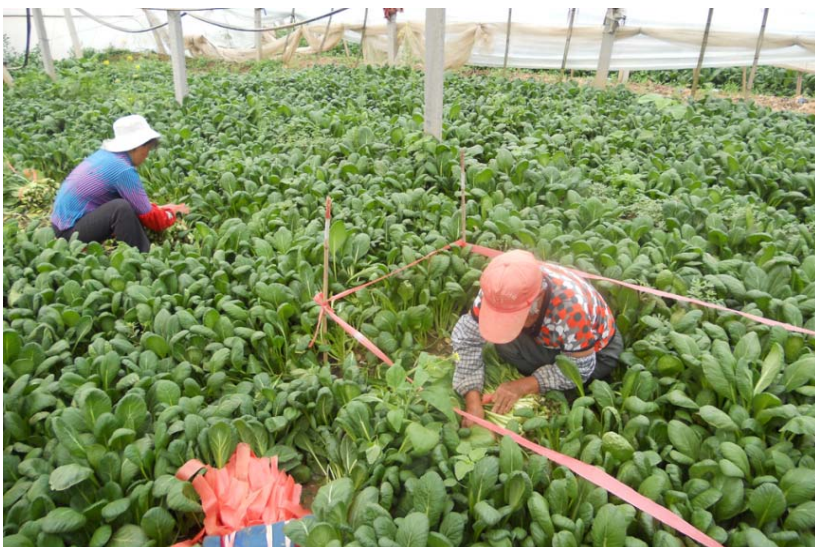
試験栽培のハウスで元気に育つ小松菜（中国山東省萊陽市）