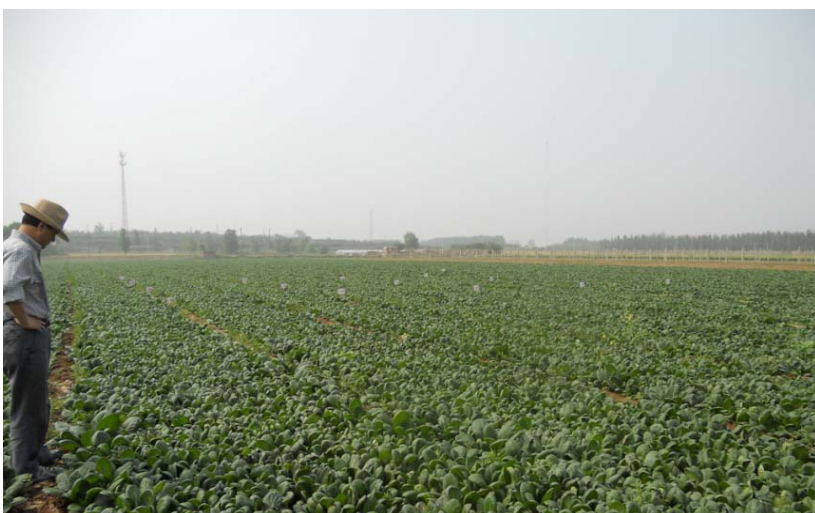
肥効試験を行っている圃場（中国山東省萊陽市）