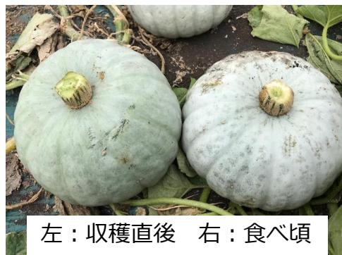
左：収穫直後 右：食べ頃